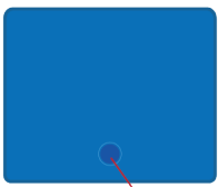
Fig. 2/ Abb. 2/ Imagen 2/ Image 2