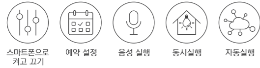
스마트폰으로 켜고 끄기 예약 설정 음성 실행 동시실행 자동실행

조명을 켜놓고 나와도, 장기간 집을 비워도 안심 언제 어디서나 집 안의 조명을 확인하고 끄고 켤 수 있는 스위치