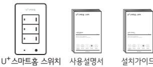
U+ 스마트홈 스위치 사용설명서 설치가이드